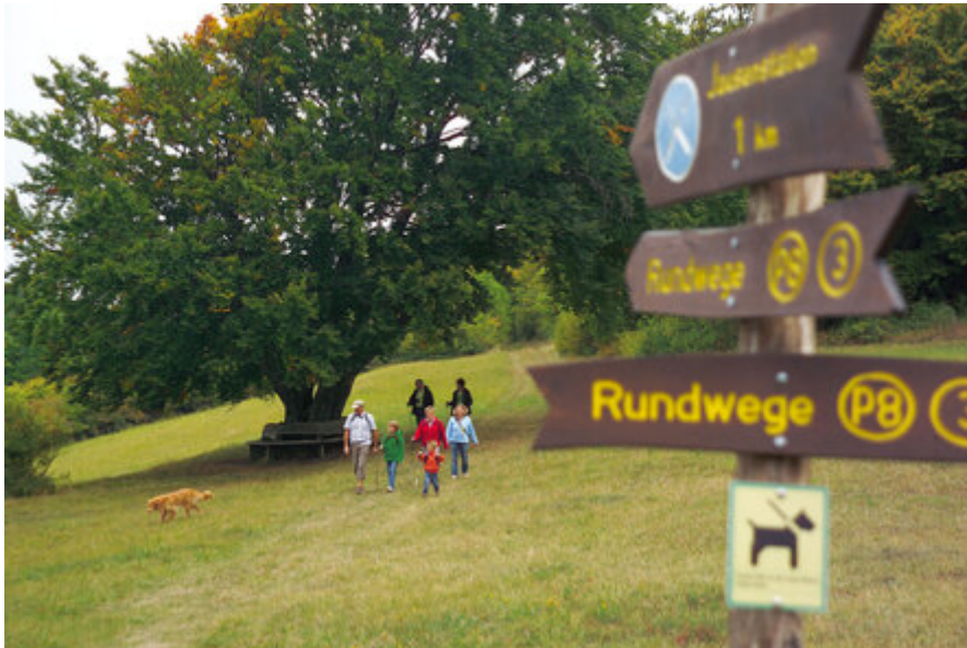
Qualitätswandern u. a. auf zertifizierten Premiumwegen.

Fachbereiche / Einrichtungen » NWM Nahverkehr Werra-Meißner » Tourismus