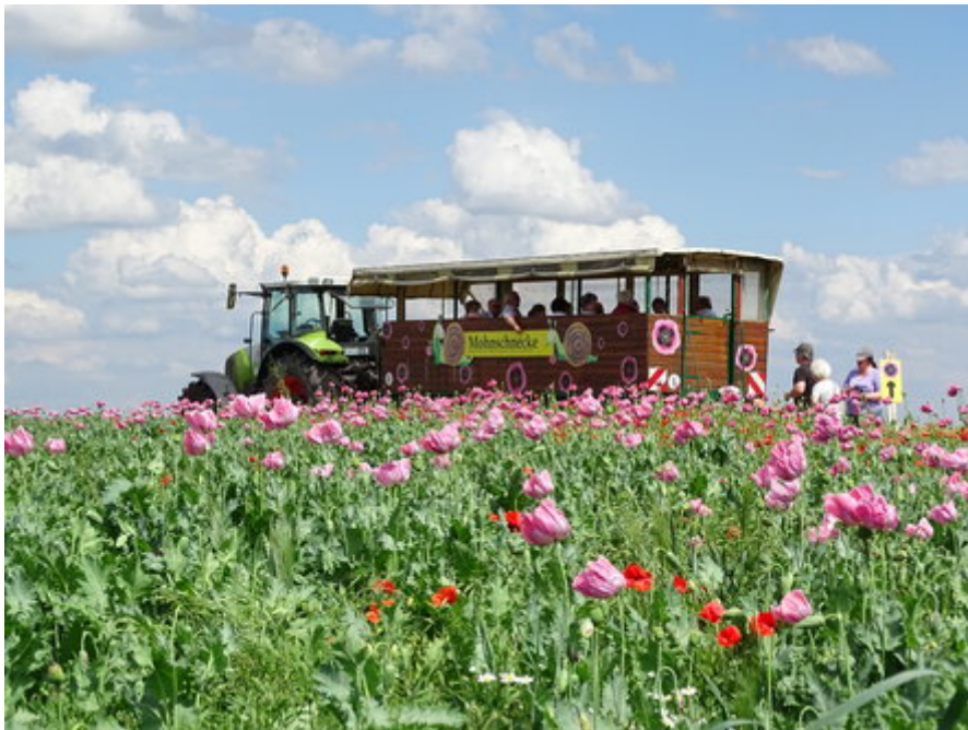
Beliebtes Naturschauspiel: die Mohnblüte in Germerode und Grandenborn.